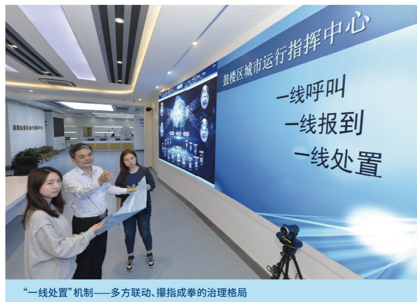
“一线处置”机制——多方联动、攥指成拳的治理格局

水深则鱼悦，城强则贾兴。鼓楼区始终致力于优化服务赋能企业发展，从金融活水、法治护航、技术支持、商务配套、政企直通等方面发力，以一流营商环境，厚植良好的发展生态、发展土壤。