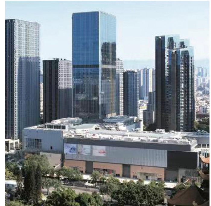
福州万象城——全市高端消费新标杆