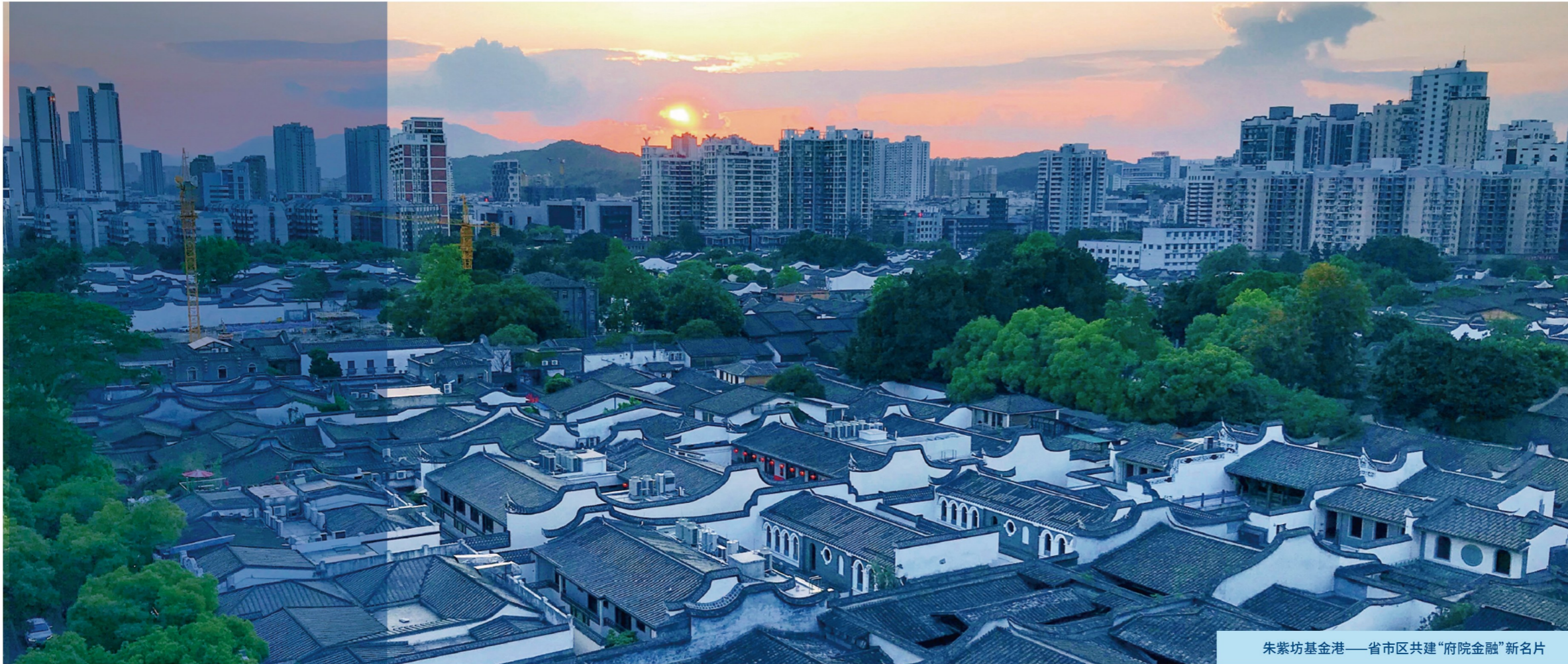
朱紫坊基金港——省市区共建“府院金融”新名片