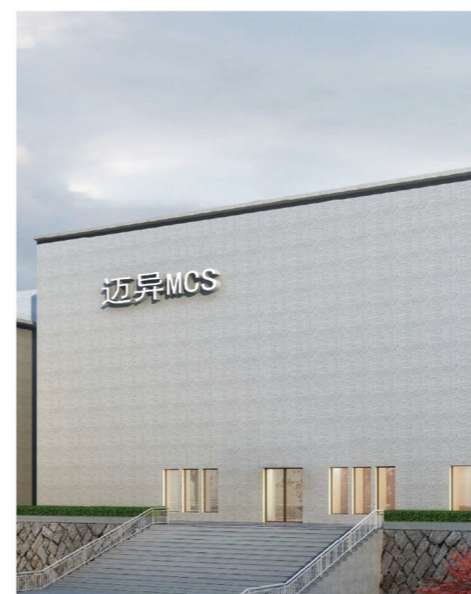
MCS云中心·福州——“云管家”24小时专业服务